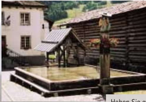
Haben Sie gewusst, dass in Valendas der grösste Holzbrunnen Europas steht?