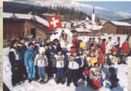
Noch gibt es sie, die Kinder von Valendas. Sorgen wir dafür, dass auch sie eine Zukunft in unserem Dorf haben.