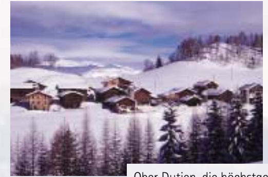
Ober Dutjen, die höchstgelegene Fraktion der Gemeinde Valendas (1501 m ü.M.).