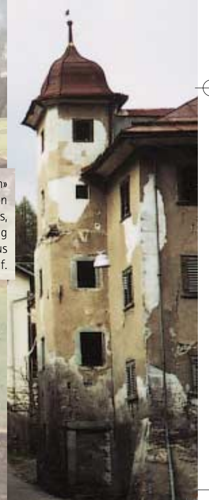
Eines der «Wahrzeichen» des Dorfplatzes von Valendas, das Türalihus, wartet sehnsüchtig auf seine Erweckung aus dem Dornröschenschlaf.