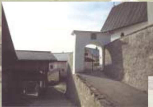
Wer in Valendas auf Entdeckungsreise geht findet viele interessante Winkel.