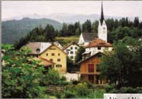
Alt und Neu ergänzt sich gut und bürgt für Lebensqualität.