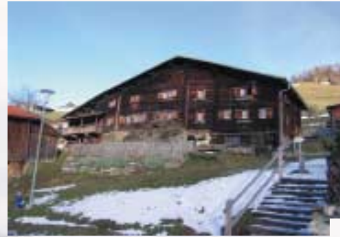
Die Fraktion Brün hoch über Valendas beherbergt eines der breitesten Walsenhäuser der Alpen.