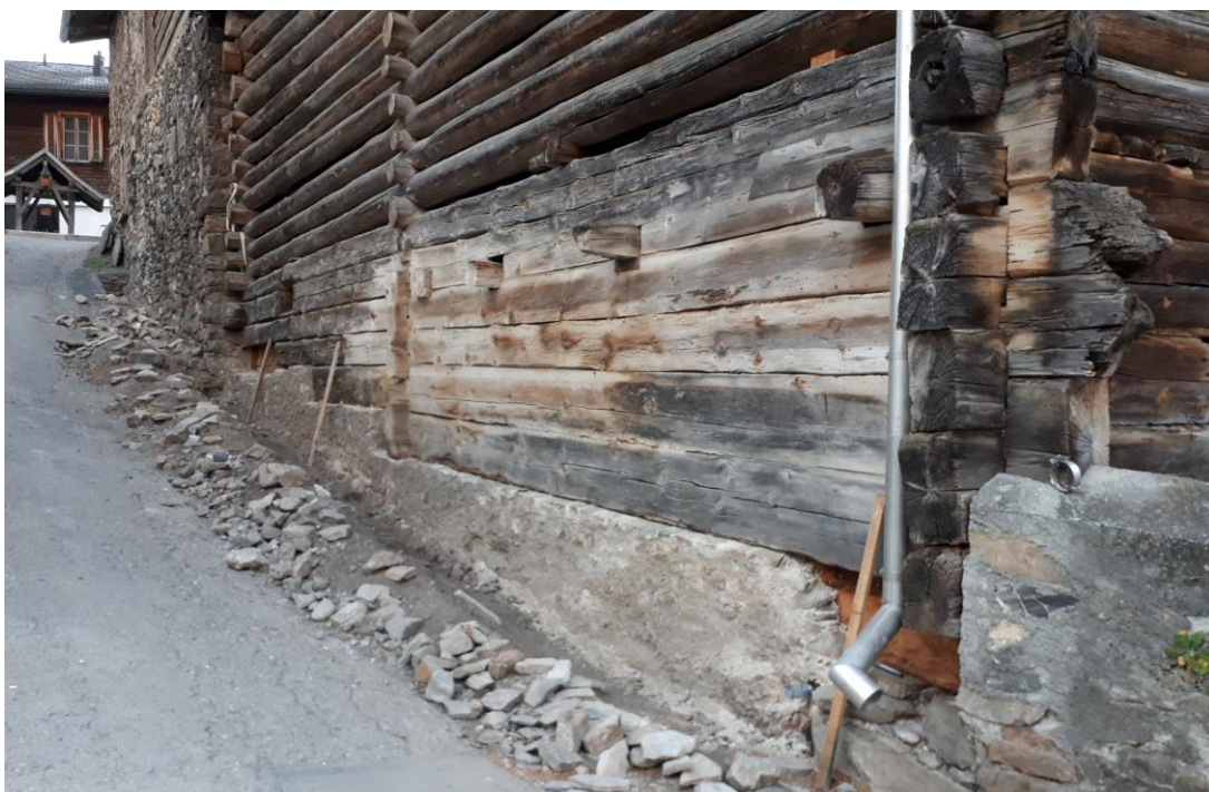
Die Sicherungsmassnahmen an Haus und Stall sind abgeschlossen