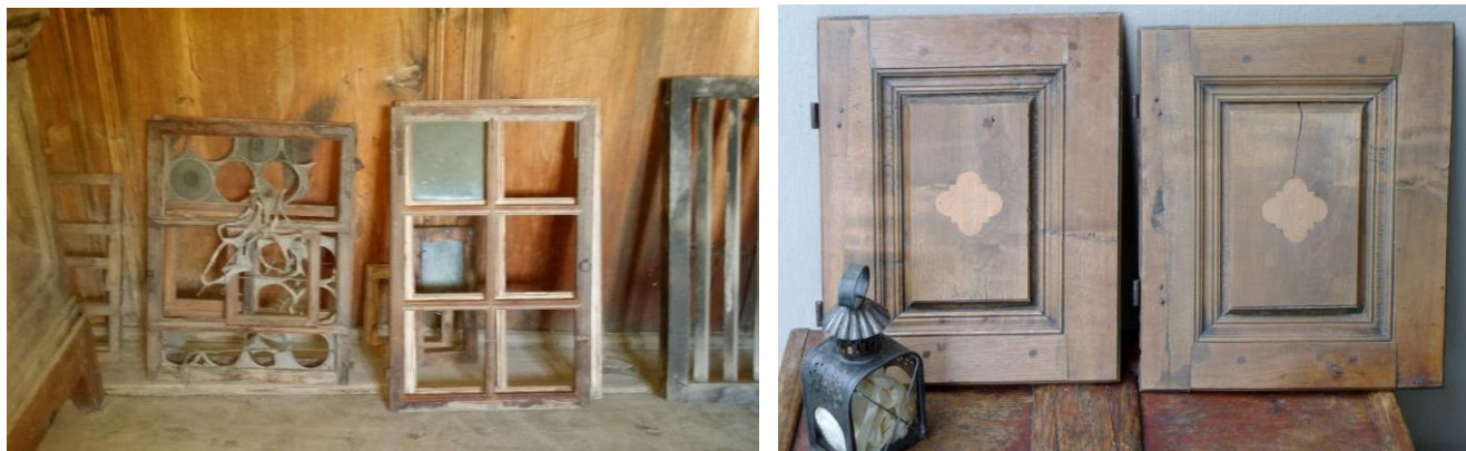
Viele Gegenstände warten auf den Wiedereinbau

Mit den erfolgten Sicherungsmassnahmen ist der Erhalt des Jooshuus und des angebauten Stalles für die Zukunft gesichert. Offen ist noch, wie die Liegenschaft genutzt werden kann.