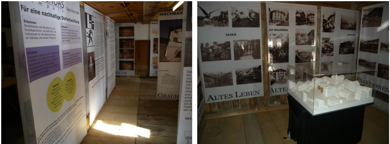
Impressionen der Ausstellung im „Bächlistall“

Die Ausstellung «Erwachen zu neuem Leben» im Bächlistall in Maltun ist in die Jahre gekommen. Weiterhin besuchen viele Personen und Personengruppen die Ausstellung über die Dorfentwicklung von Valendas.