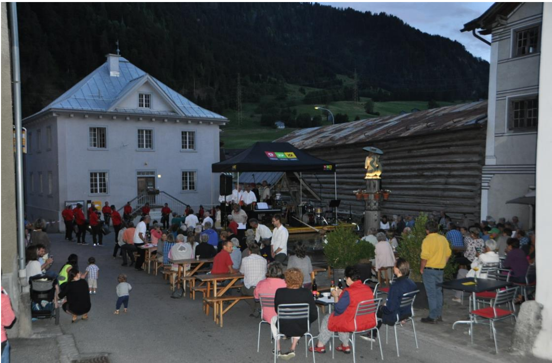
Das Brunnenfest auf dem historischen Dorfplatz ist immer wieder ein besonderes Erlebnis