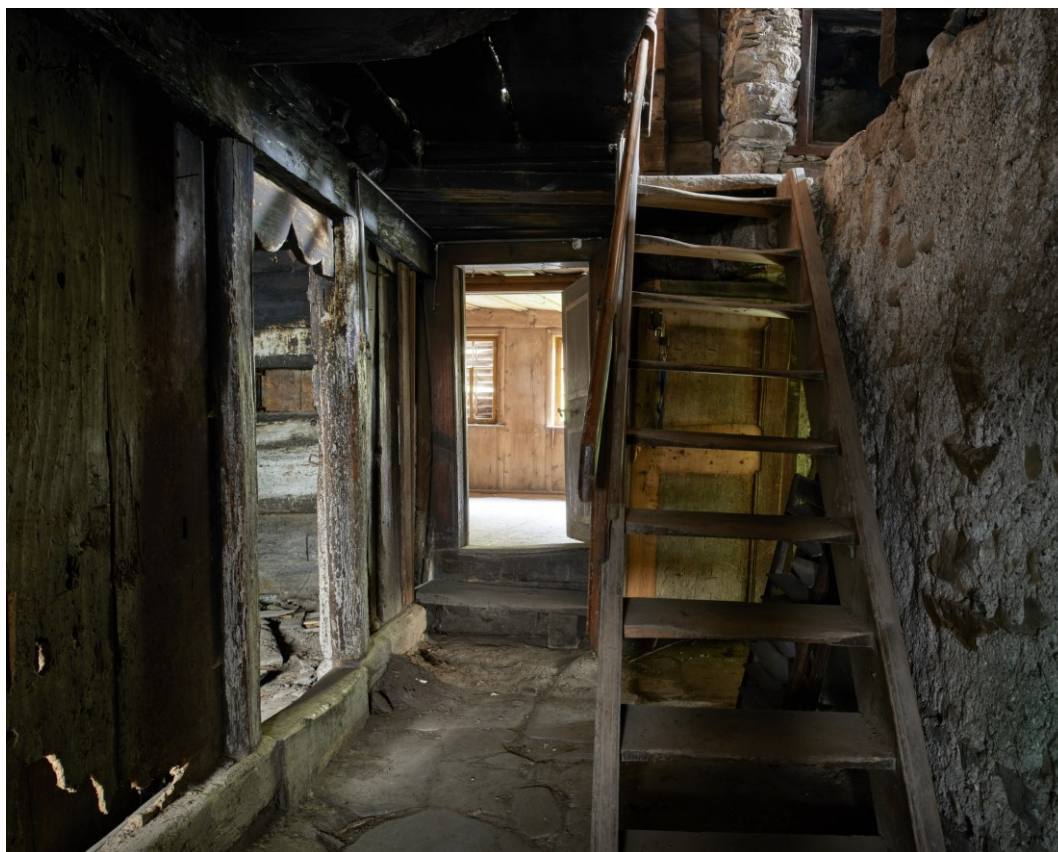
Durch die Sanierung der Treppen, Geländer und Böden wird das Jooshuus für die Öffentlichkeit sicher begehbar und begrenzt nutzbar

Die Kosten belaufen sich auf total Fr. 200'000.--. Beiträge von Bund und Kanton betragen je 35 %. Der Restbetrag von Fr. 60'000.-- wird je zur Hälfte durch Spenden und durch Entnahme von Rückstellungen finanziert. Die entsprechenden Beitrags- und Spendengesuche sind eingereicht. Gemäss mündlichen Rückmeldungen sind wir optimistisch, dass die Finanzierung und damit eine Ausführung der Arbeiten im 2020 möglich sind.