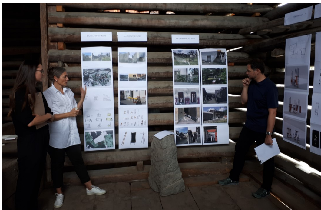
Erste Begehungen und inhaltliche Diskussionen haben bereits im Joosstall stattgefunden

Der Vorstand hat gemäss Auftrag der Mitgliederversammlung zusammen mit dem Naturpark Beverin die Möglichkeiten geprüft, wie und in welcher Form die Ausstellung überarbeitet und weitergeführt werden kann. So ist es vorgesehen die Ausstellung in der vereinseigenen Liegenschaft Joos zu platzieren. Die Abklärungen sind so weit fortgeschritten, dass an der Mitgliederversammlung am 27. März 2020 ein Projekt vorgestellt und der Kredit aufgrund einer Kostenschätzung beantragt werden kann. Zusammen mit der Ausstellung wird auch der Dorfrundgang überarbeitet. Damit ist gewährleistet, dass Ausstellung und Dorfrundgang aufeinander abgestimmt sind. Die Umsetzung erfolgt dann etappenweise in den Jahren 2020 bis 2023. Wir freuen uns auf die Diskussion und hoffen auf eine Zustimmung der Mitglieder.