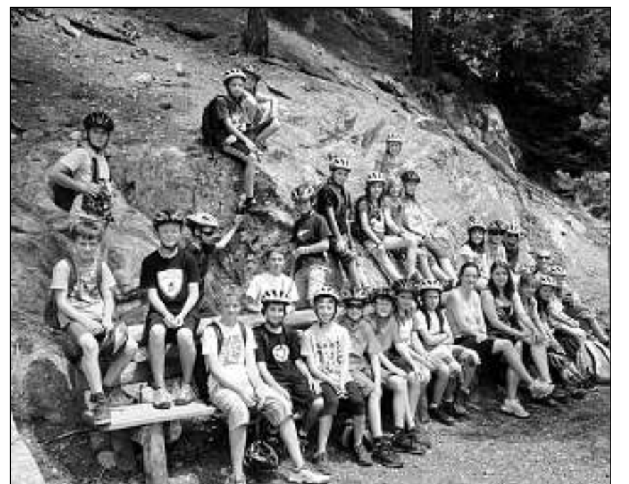
La grupa da velo dalla 4- e 5avla classa durant ina pausa silla tura da velo denter Puntraschna e Zernez.