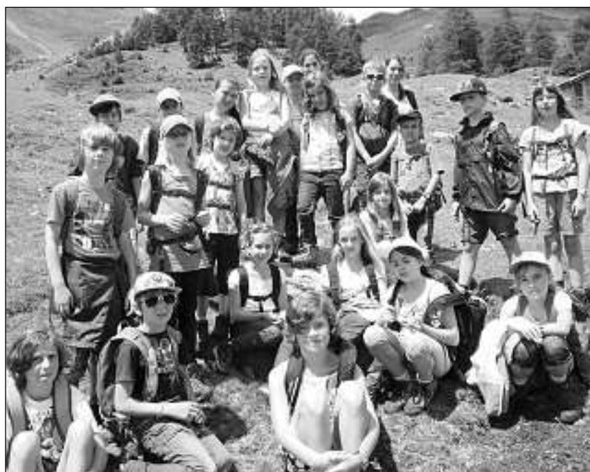
Scolars dalla 1. entochen la 3. classa sils fastitgs d'Ursin a Guarda.