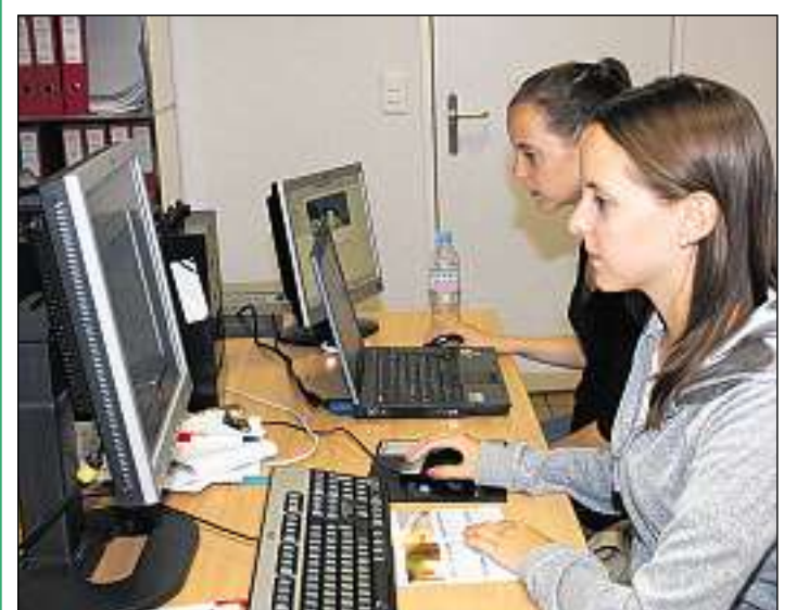
Gist tar las mattas è en amprendissadi mercantil anc adegna fitg popular.